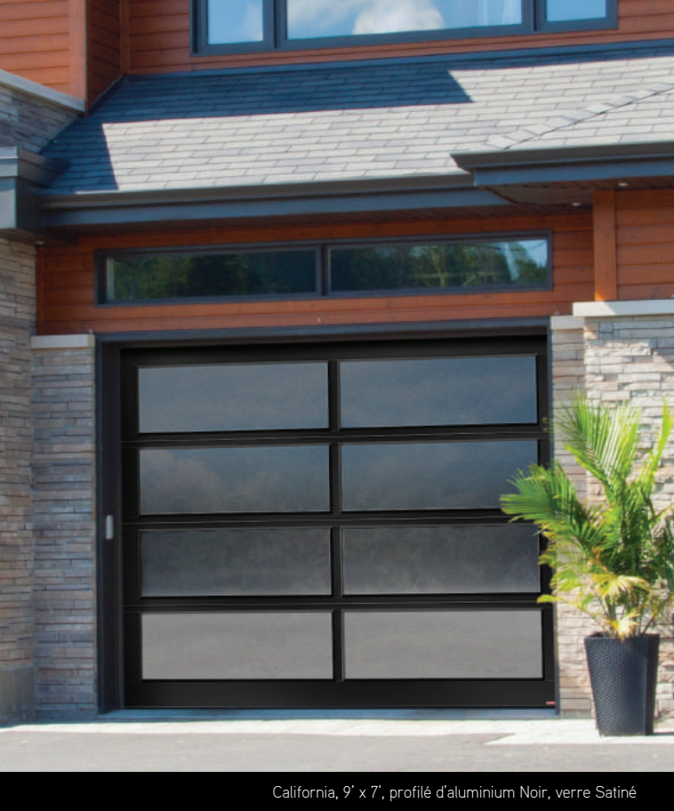
California, 9' x 7', profilé d'aluminium Noir, verre Satiné