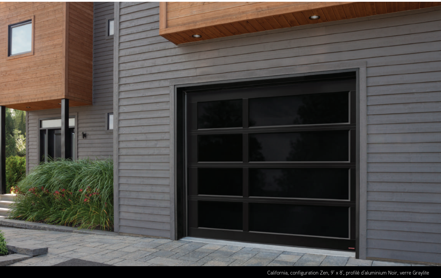
California, configuration Zen, 9' x 8', profilé d'aluminium Noir, verre Graylite