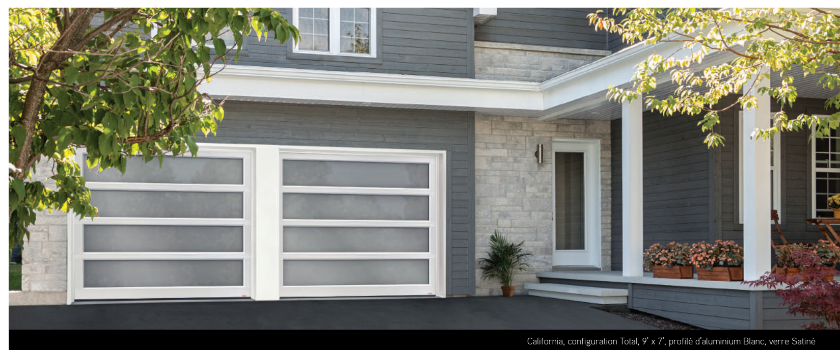
California, configuration Total, 9' x 7', profilé d'aluminium Blanc, verre Satiné